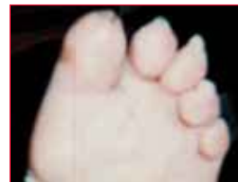
Después del tratamiento endovascular

* Los resultados pueden variar de un individuo a otro.