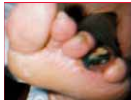
Antes del tratamiento endovascular